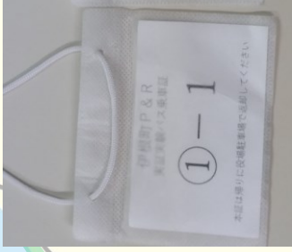
P & R で運行する無料バス