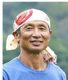
ビオ・ラビッツ(株)