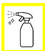
アルコール除菌や抗菌加工