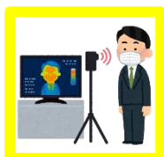
サーモグラフィーの購入