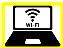
ワーケーション環境整備