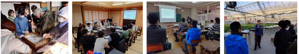
（写真：プログラム実施の様子）