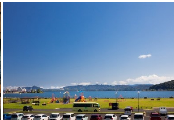
あまのはしだてテラスからの眺め*イメージ